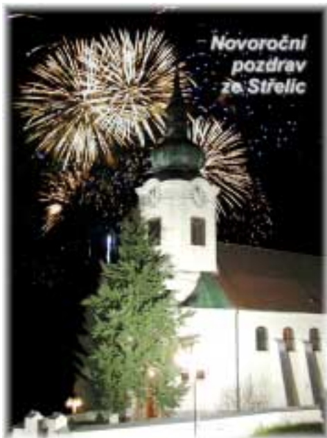
Pohlednice vydaná obcí Střelice.