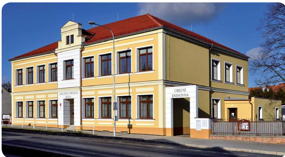
Budova ZUŠ a obecní knihovny po rekonstrukci