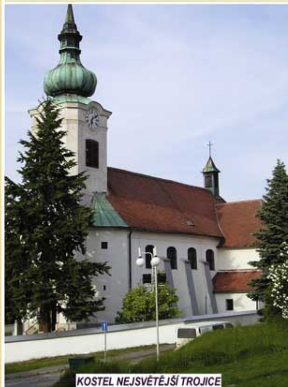
KOSTEL NEJSVĚTĚJŠÍ TROJICE