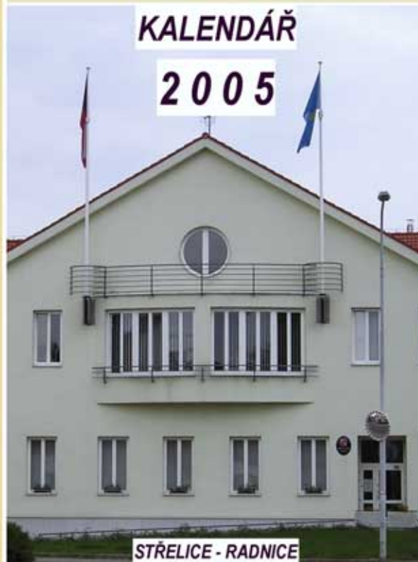
STŘELICE - RADNICE