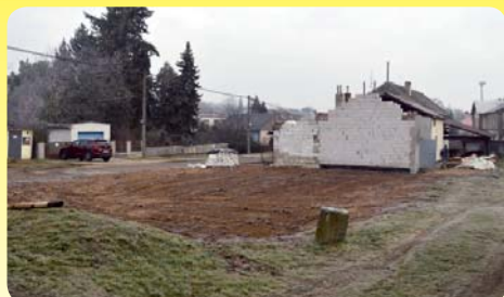
Pokračování na str. 2.

Snížená sazba poplatku (pro důchodce) je nově stanovena pouze pro držitele psa starší 65 let.