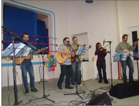
Za skupinu Ibatak