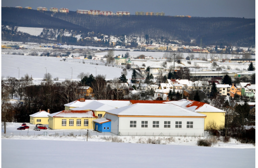
Fotografie od pana Jiřího Fukana z letošní mimořádně dlouhé sněhové pokrývky u nás v obci.

Dopláceli jsme tedy na likvidaci odpadů v obci za rok 2009 částku 132.438,- Kč, což je celkem příznivá bilance. Zde je jasně vidět, že se vyplácí třídění odpadu na dané komodity. Obec za třídění sběru obdrží i nezanedbatelné částky. Na závěr jen přepočítáme