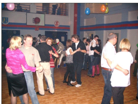
Za spolupřadatele MJ