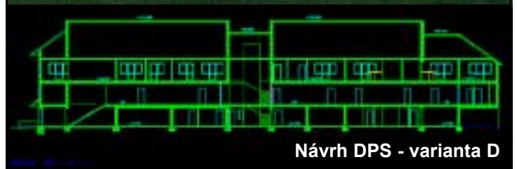
Návrh DPS - varianta D