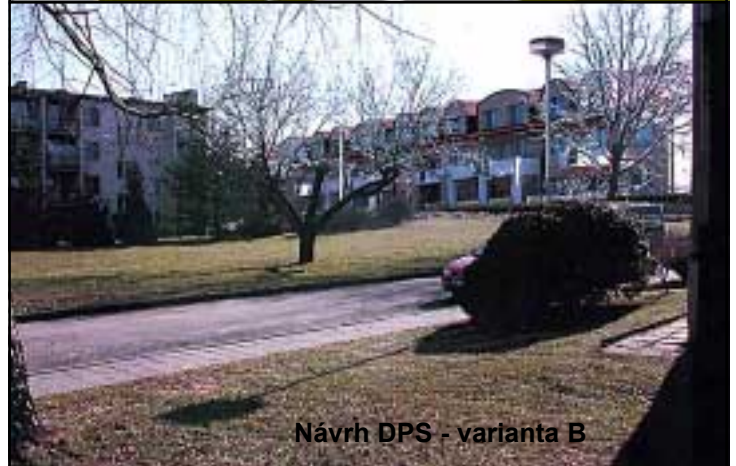
Návrh DPS - varianta B