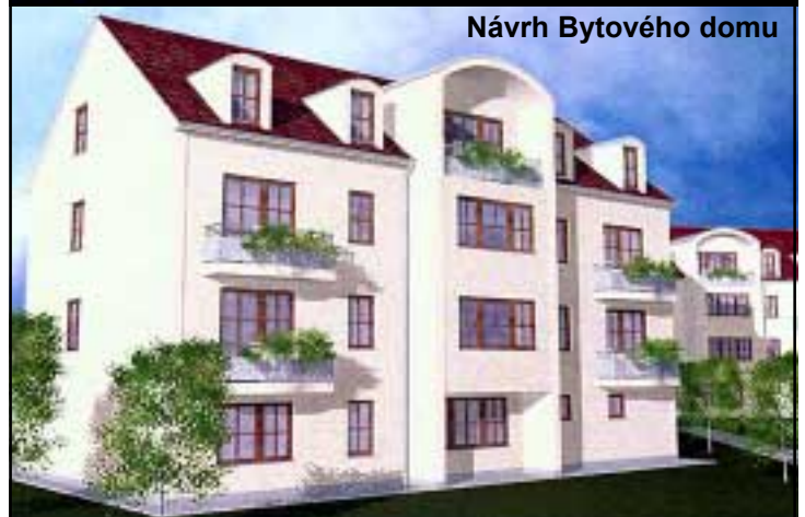
Návrh Bytového domu