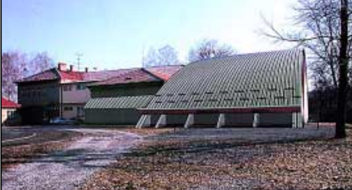
Návrh Sportovní haly - varianta C