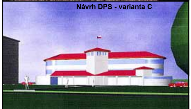
Návrh DPS - varianta C