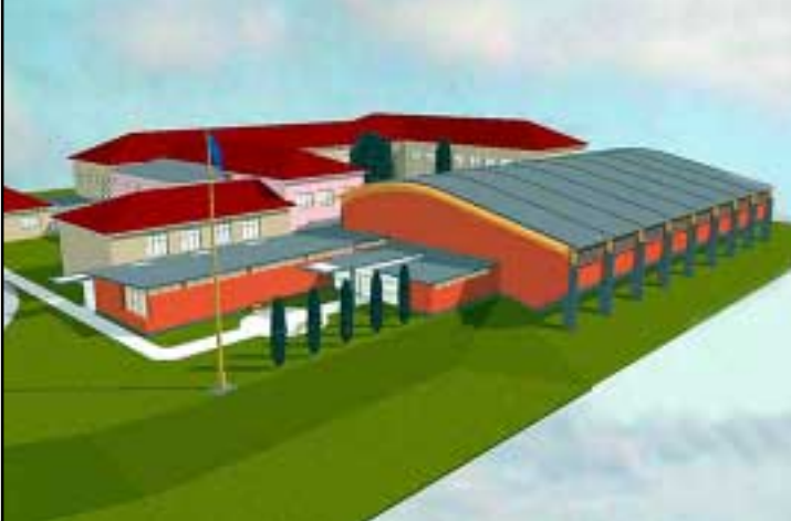
Návrh Sportovní haly - varianta B