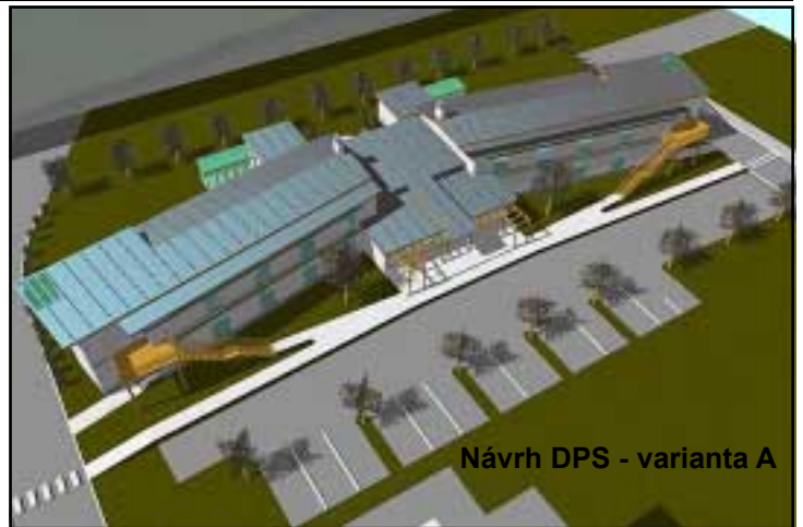
Návrh DPS - varianta A