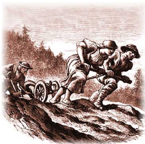
Duben laškuje, sedlák za pluhem hubuje.

Dále místostarosta seznámil s informací Pozemkového fondu ČR, že obec může požádat o převod pozemků, které jsou vlastnictvím ČR a ve správě fondu. V našem případě se jedná o pozemky u restaurace U nádraží, p.č. 3144 PK (výměra 1721 m 2 ), p.č. 861/2 (192 m 2 ), p.č. 861/3 (196 m 2 ), p.č. 2011 (334 m 2 ), p.č. 1014/2 PK (1666 m 2 ), p.č. 2272/4 PK (27 m 2 ), p.č. 409/13