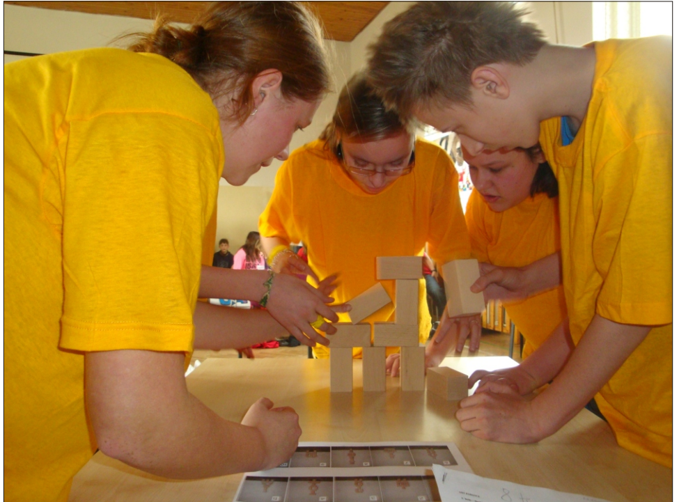
Překročit Rubikon... ... aneb chcete se vsadit?

Na jednání 21. zastupitelstva obce dne 23.3.2010 jsme definitivně schválili zahájení stavby nové mateřské školy v podobě výstavby dvou pavilonů se třemi třídami MŠ, s přivedenými sítěmi, s technickým zázemím, s plným vybavením a s povinným vybaveným hřištěm. Celková cena vyjmenovaných stavebních objektů je asi 41 milionů korun. Stavbu nelze odkládat, neboť budova staré školy, kde se nyní nachází 2 třídy mateřské školy, není v dobrém technickém stavu, nelze tam rozvíjet modernější metody předškolní výchovy a hygienická správa povolila provoz za podmínky, že se ještě letos zahájí výstavba nové školky. Stavba začne předáním staveniště dodavatelé stavby dnem 29.3.2010. Bude stát na prostranství za obchodním domem SATOV. Dokončení školy s kolaudací se plánuje