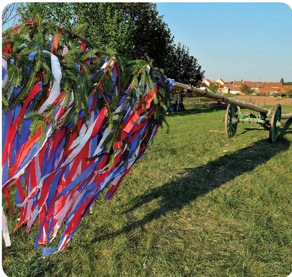
Tradiční stavění máje ve Střelicích

Firma Ekostavby a. s. dokončila za účasti pracovníků obce vyčištění celého koryta Střelického potoka a břehy osela travou. Práce na cyklotrase údolím říčky Bobravy nabraly na obrátkách. Bylo provedeno odbagrování zeminy, vytrhány kořeny vytěžených stromů a keřů, cesta byla srovnána, navezen podkladní štěrk a zhutněn vibračním válem.