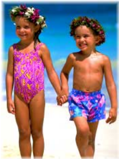
Mezinárodní den dětí