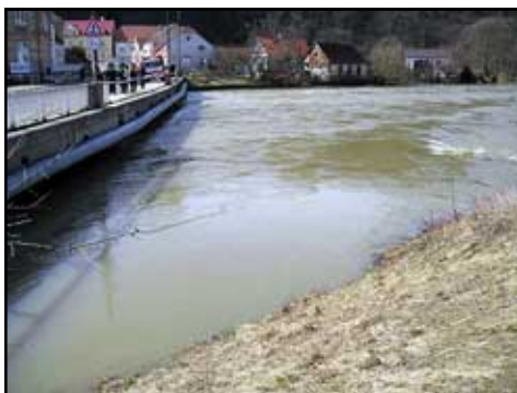
Obrázek 3 - Pohled na řeku Dyji v místě měření.