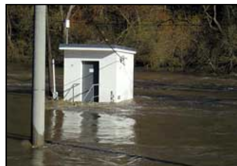
Obrázek 5 - Zaplavená vodoměrná stanice Podhradí nad Dyjí.

trvání vodních stavů a SPA - stupně povodňové aktivity , červeným kolečkem je vyznačeno měření). Kulminace zde nastala při vodním stavu H=472 cm. Zde jsme pozorovali výskyt pevných i pohyblivých ledových útvarů. To byla hladina ve Vranovské přehradě cca 8,5 m pod přelivnou hranou (na hladině ještě led), během 3 dnů se přehrada naplnila a potom více než 4 dny (od 30.3. do 3.4.) přetékala voda přes přelivnou hranu při max. hladině 95 cm nad přelivem. Dne 30.3. byla téměř zachycena kulminace v Podhradí na Dyji - změřen průtok 340 m 3 .s -1 a ve Vranově nad Dyjí naměřeno 262 m 3 .s -1 . Na obrázku 5 je vidět zaplavená vodoměrná stanice v Podhradí.