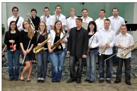
Otázky pokládal David Otoupalík