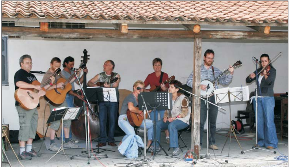
Střelické strunobraní 2008 - V neděli 15. června 2008 čas 5:31 dozněla poslední struna letošního ročníku již tradiční přehlídky kapel folk a country. Pokud se vám líbilo – na slyšenou na 7. ročníku STRUNOBRANÍ v polovině června 2009.