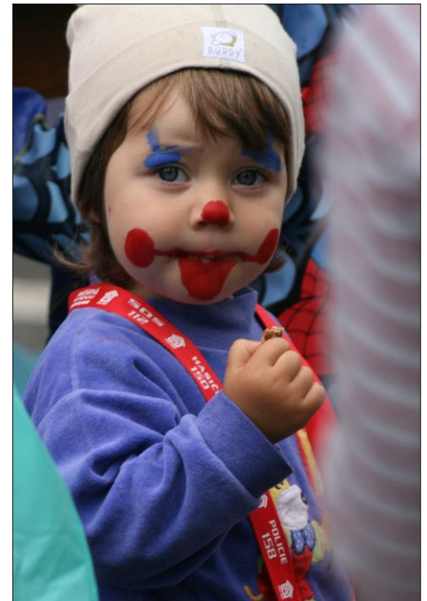
Úsměv k nezaplacení