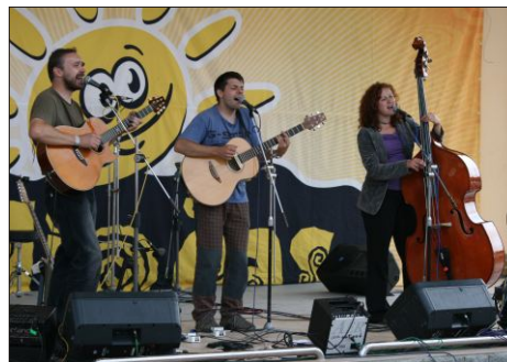
Nakažlivá Epy De Mye