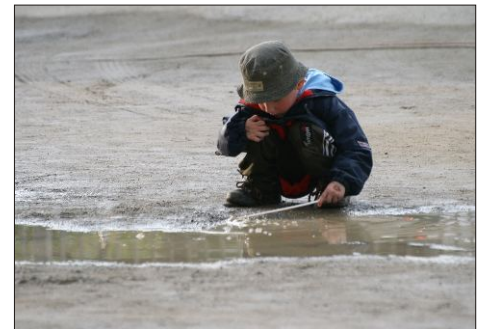
Nepohoda pořadatelů - radost dětí

Pro Střelický zpravodaj připravil David Otoupalík