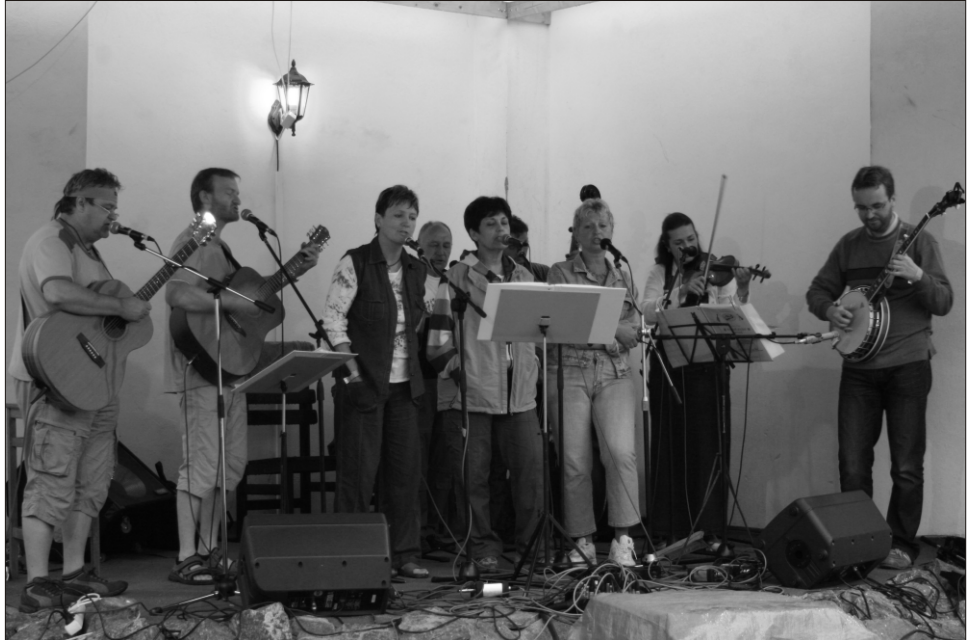
STŘELICKÉ STRUNOBRANÍ – vystoupení skupiny Liduš

Krásné byly i tradiční Mladé hody, kdy se stárkům a stárkám vydaří hlavně nedělní den (7.6.). Naši aktivní hasiči připravují společně