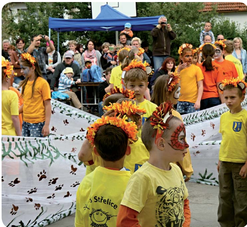
Dětský den ve Střelicích