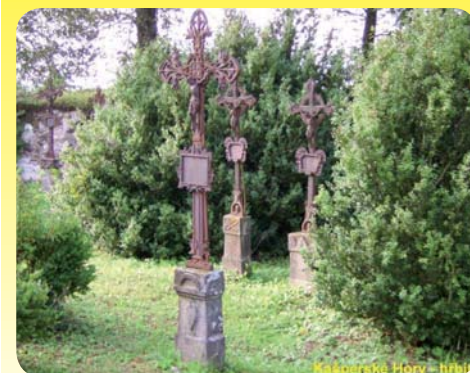
Pokračování na str. 6.

Teď představím místa, která mě zaujala a která mám rád (a do některých se opakovaně vracím). V blízkosti města je to hřbitov s trojlodní bazilikou sv. Mikuláše a s poutní kaplí sv. Anny. Jsou to významné památky středověké architektury. Ale pro mě tu je jiné memento: desítky opuš-