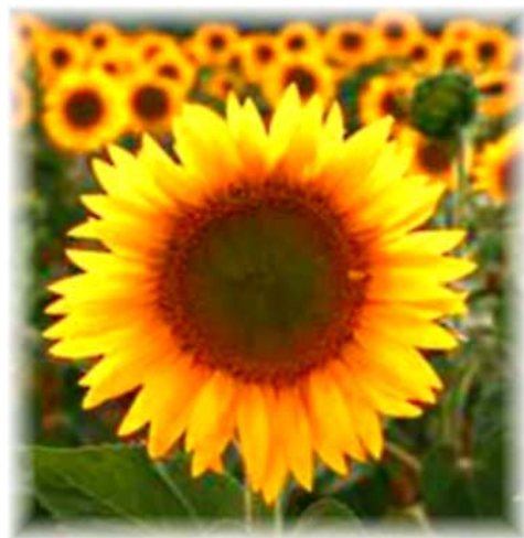
Léto v plném proudu!