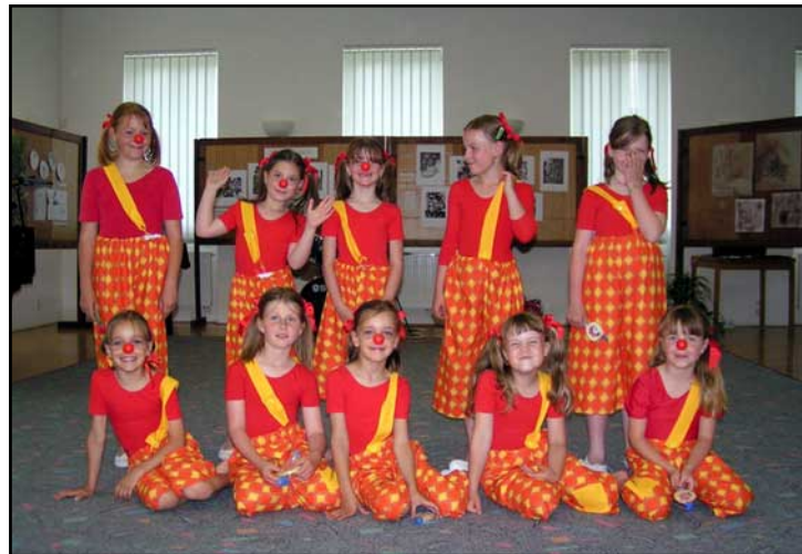
Grupa v Tavíkovcích