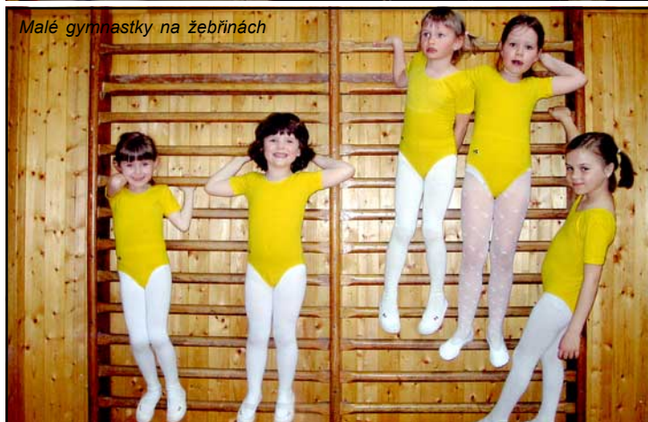
Malé gymnastky na žebřících