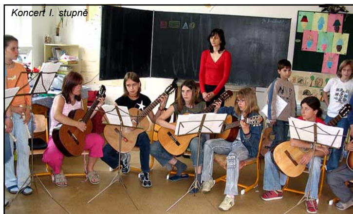
Koncert I. stupně

Začátkem školního roku třídy soutěží v množství nasbíraných šípků a dosáhnou-li alespoň průměru 2 kg na žáka, mohou si vybrat jeden vyučovací den dle svého zájmu. Většinou se svými třídními učiteli zhlédnou některé filmové představení. Letos to byl Mrázik, Příběh žraloka, Snowboardáci a další. Některé třídy navštívily brněnské vánoční trhy, kde děti tradičně pečlivě vybírají dárky pro svoje nejbližší.