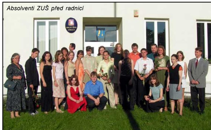
Absolventi ZUŠ před radnicí