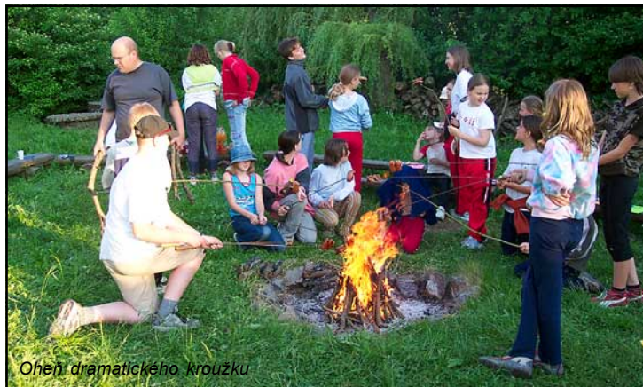
Oheň dramatického kroužku

Letos se náš početný divadelní soubor Mraveneček rozhodl, že zakončí svoji sezónu přenocováním ve škole. V pátek 3.6.2005 se téměř všichni ze souboru sešli ve škole a dobrodružství mohlo začít. Do soboty do oběda jsme si užili spoustu legrace při různých hrách, scénkách a opékání špekáčků. Odměnou pro každého malého herce bylo Divadelní vysvědčení, na kterém se smála velikánská jednička.