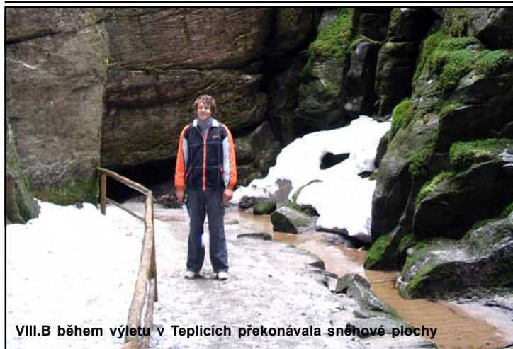
VIII.B během výletu v Teplicích překonávala sněhové plochy