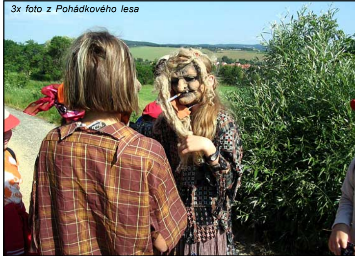
3x foto z Pohádkového lesa

Pohádkový les pro děti z MŠ a I. stupně ZŠ.