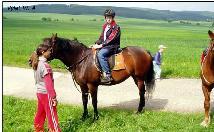
Výlet VI. A

Odměnou za celoroční snažení jsou pro žáky školní vlastivědné zájezdy a školy v přírodě. Pro mnohé jsou to nezapomenutelné zážitky, poznání nových končin naší země, přírodních útvarů, krajin a zvyků. A to všechno v kolektivu svých vrstevníků. Týdenní školy v přírodě žáků I. stupně se uskutečnily v rekreačních zařízeních v Zámečku u Hodonína a Pastvinách u Kyjova. V rámci školních vlastivědných zájezdů poznali Prahu, Moravský kras, Českomoravskou vysočinu, Český ráj, Děčínsko, Nesměř, Adršpach, Klatovec a jižní Čechy v okolí Nežárky.