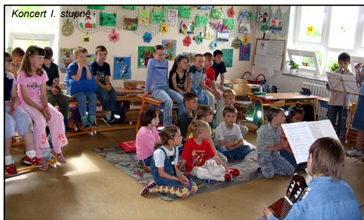
Koncert I. stupně

Další zdařilé exkurze a programy, které žákům připravili jejich učitelé: Ukázky výcviku služebních psů, návštěva Úřadu práce pro vycházející, návštěva INVEXU, středisko Lužánky - Výrobky z papíru, návštěva knihovny ve Střelcích, vystoupení Gajdoši s vánočními zvyky, vystoupení brněnského Valášku, hodina O vývoji hudebních nástrojů, exkurze devátých tříd do výrobních firem, výchovný koncert s dechovkou a dějinami hudební tvorby, vystoupení Dády Patrasové, představení O Mráziku, divadelní představení Strašidelný mlýn v divadle Bolka Polívky, Lucerna, představení čert to nemá nikdy lehké, Kašpárek a drak, pořad Bambulkov.