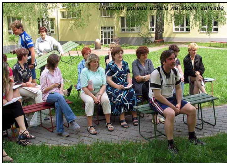
Pracovní porada učitelů na školní zahradě