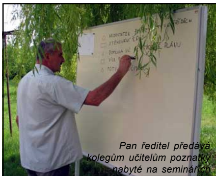
Pan ředitel předává kolegům učitelům poznatky nabyté na seminářích

Vzdělávací činnost byla prováděna podle vzdělávacího programu Základní škola, č.j. 16 847/96, ve znění pozdějších úprav a doplňků. Dnem 1. ledna 2005 vešel v platnost nový Školní zákon, který znamená zásadní změnu dosavadního vzdělávacího programu. A tak i naše škola již usilovně pracuje na Školním vzdělávacím plánu a Rámcově vzdělávacích plánech pro jednotlivé vyučovací předměty. Touto změnou již v minulosti prošly mateřské školy a závazná je pro školní rok 2007/08 v I. a VI. ročnících ZŠ. Její realizace bude vyžadovat kromě pedagogů také asistenty a zvyšování vybavenosti počítači.