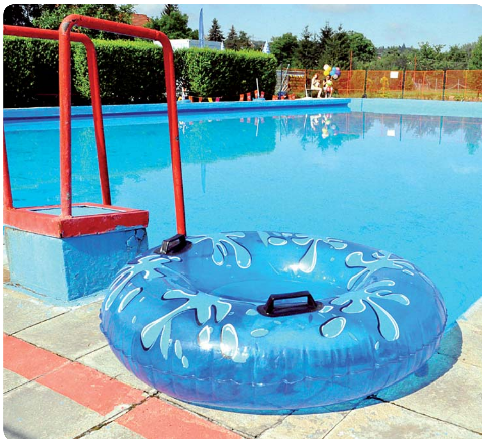
Koupaliště ve Střelicích

V současné době provádí firma Tovop-term s.r.o. rekonstrukci odpadních svodů