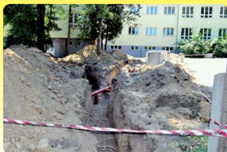
Pokračování na str. 2.