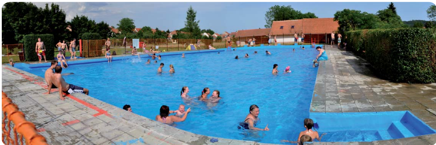
Koupaliště ve Střelících