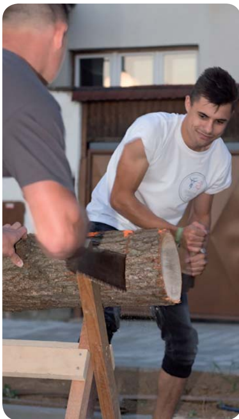
Celá akce se vydařila a tanec, zpěv i zábava trvaly až do začátku dalšího dne. Děkuje všem za účast, spolupráci a podporu. Střelická Chasa

Večer byl zpestřen soutěží v řezání dubové klády na rychlost. Bylo mnoho zdařilých i méně zdařilých pokusů. Nejlepší čas byl 57 vteřin. Pro vítěze byla připravena výhra v podobě multi-packu piva a láhve vína. Tyto ceny nakonec putovaly do Nebovid odkud byla nejrychlejší dvojice.