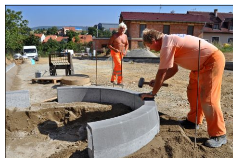
Fotografie zhotovil Jiří Fukan. Další snímky naléznete na www.streliceubrna.cz