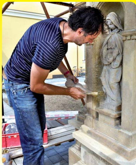
Pokračování na str. 2.

Pro práce na restaurování kříže se souchami Cyrila a Metoděje bylo zapotře-