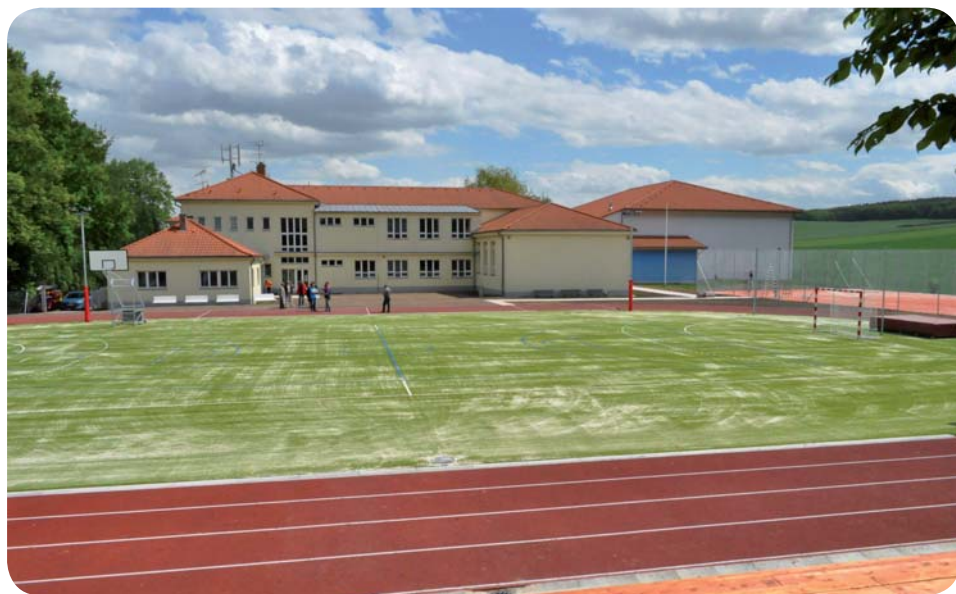
Začíná školní rok 2017/2018

Práce na rozpracovaných stavbách v obci se však nezastavily. Firma SVIP s.r.o. dokončila stavbu hřbitovní zdi směrem na Ostopovice a tuto část předala obci k užívání. Jak jsem již v minulém zpravodaji zmínil, s opravou zdi z ulice Brněnská bude firma SVIP s.r.o. pokračovat v měsíci září. Co se týká oprav učeben staré školy, jsme prozatím ve fázi měření vlhkosti podkladové betonové vrstvy. Do současné doby proběhla dvě měření, ale prozatím výsledné hodnoty neumožňují započít s pokládkou podlahové krytiny. Další měření proběhne až na konci měsíce srpna, a tak můžeme jen doufat, že naměřené hodnoty nám již dovolí zdárně dokončit započatou opravu. Rekonstrukce elektroinstalace, obklady a vymalování v objektu mateřské školy v Cihelně je již dokončeno a budova je již připravena na to, až se 4. září její prostory zaplní hlaholem dětských hlásků (viz obr. č. 1). Generální oprava dět-