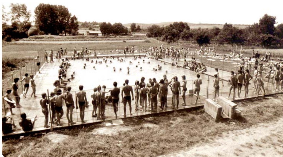
Fotografie ze dne 27. července 1988