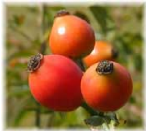
Fouká ze strnišť...

V různém seznámil starosta se situací ohledně zřízení detašovaného pracoviště pověřeného úřadu III. typu Šlapanice v Brně, které by mělo být v provozu místo zrušeného Okresního úřadu Brno-venkov od nového roku. Situace je stále nejasná, čeká se na výsledek jednání vlády ČR, které bude v říjnu. Další informace Ing. Kazdy se týkala voleb do zastupitelstev obcí, které se uskuteční ve dnech 1. a 2. listopadu 2002, volební místnosti budou otevřeny v pátek 1.11. od 14:00 do 22:00 hod. a v sobotu 2.11. od 8:00 do 14:00 hod. Při přípravě voleb se obec řídí platným volebním zákonem. Členové zastupitelstva byli seznámeni s návrhem obecně závazné vyhlášky o zajištění veřejného pořádku při provozování veřejnosti přístupných kulturních podniků a ochraně před hlukem a vibracemi a také se stanoviskem JUDr. Vítkové k této vyhlášce. Po připomínkách z řad členů ZO bude návrh vyhlášky znovu konzultován s právníkem a řešen na příštím zasedání zastupitelstva. Zastupitelstvo dále schválilo darování prodlouženého plynovodu v ulici Za Humny Jihomoravské plynárenské a.s. Jedná se o cca o 25 m plynovodu v hodnotě 46.886,- Kč.