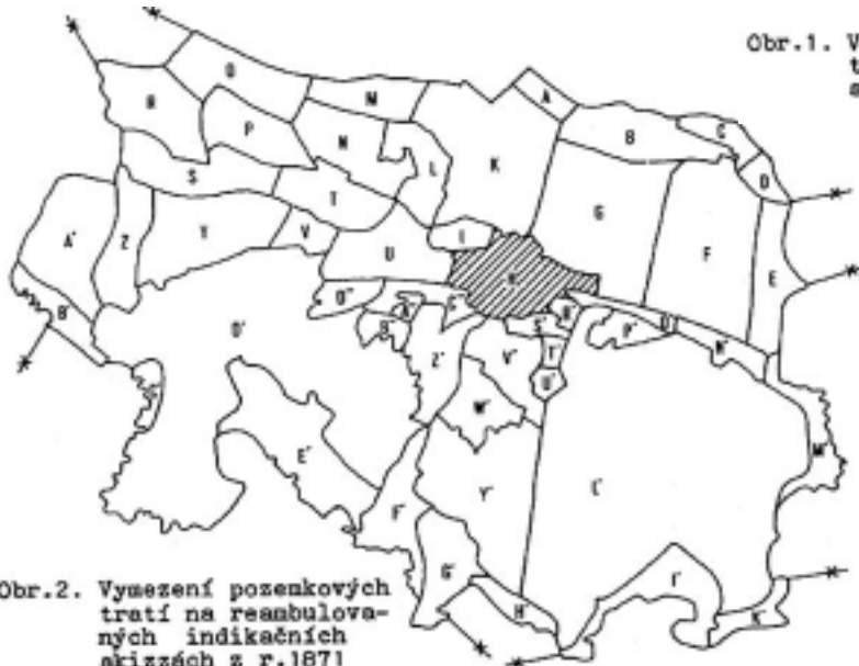
Obr.2. Vymezení pozenkových tratí na reambulovaných indikačních skizzách z r.1871