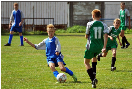
Text + foto Jiří Fukan