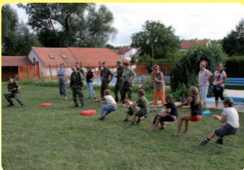
Dokončení na straně 2.

Dne 10. září se konal na hřišti u základní školy a místním koupališti dětský den, který pořádala komise kulturní, školská a sportu.