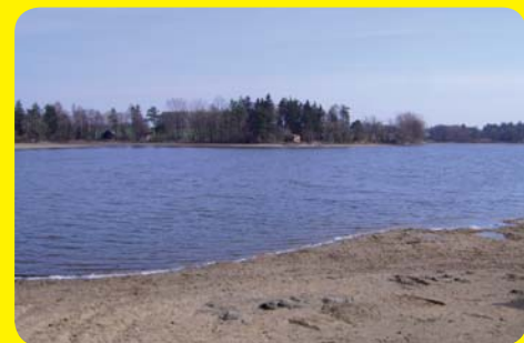
Ještě zajímavost odjinud

Trasa, kterou jsem popsal, obnáší okolo 20 kilometrů. Pro cyklisty to nic není, pro pěší dost. Ale můžete jet vlakem do Kojatína nebo Budišova a jít směrem, který si zvolíte. Pak už to bude jen polovina. Bude-li mít mapu, je příjemné cestovat v tomto prostoru křížem krážem, všude je hezky. Přeji příjemné poznávání. A takto vypadá rybník Pyšelák: