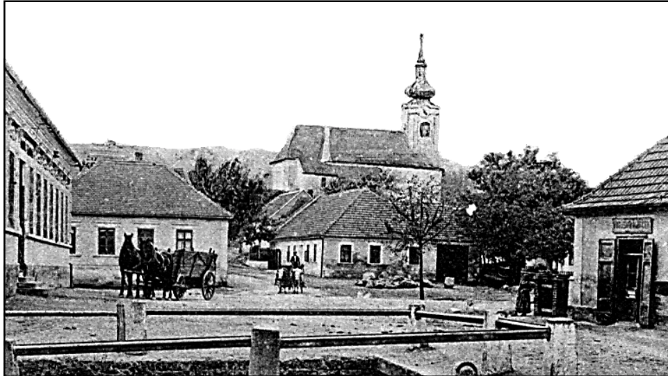
Náves v roce 1920