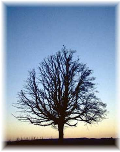
Obraz přicházejícího podzimu...

parkovali svá vozidla raději v blízkém okolí; opravy by měly být ukončeny zhruba do 20. listopadu,