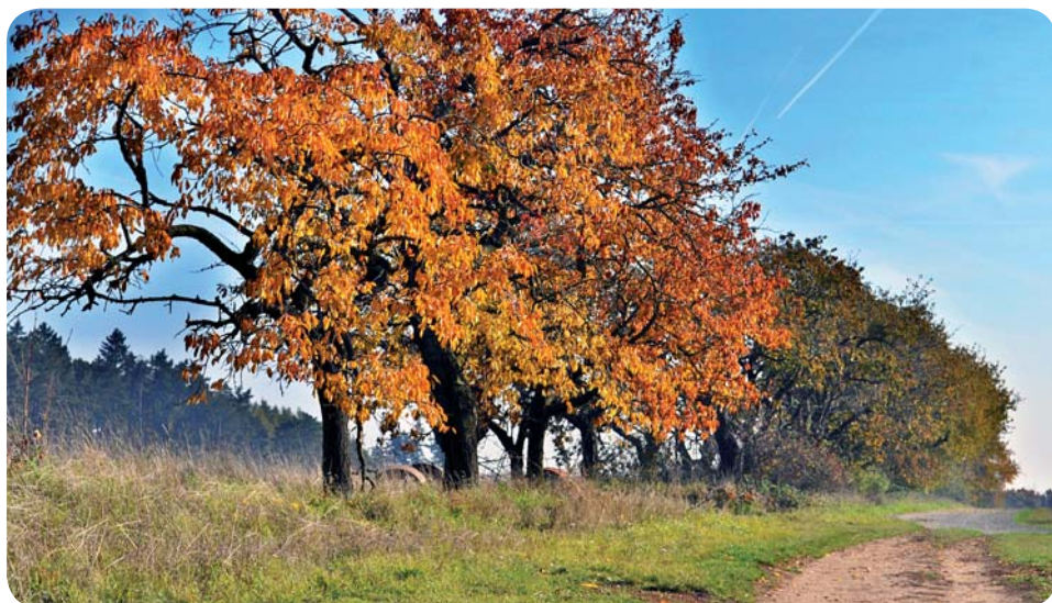
Podzim ve Střelicích

Nyní něco k dění v obci. Firma Creative Buildings s.r.o. dokončila parkovací místa před budovou staré školy a předala je obci k užívání (viz. foto č. 1). V sou-