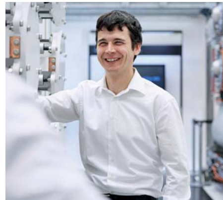
ABB je přední světová společnost poskytující technologie pro energetiku a automatizaci, které umožňují energetickým a průmyslovým podnikům zvyšovat výkonnost při současném snížení dopadu jejich činnosti na životní prostředí.

Provedeme Vás výrobou, ukážeme pracoviště a zodpovíme dotazy. S sebou si vezměte svůj životopis.