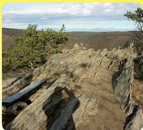
Vyhlídka Sealsfieldův kámen

Putování v okolí Popic je nejlépe začít od hospody U Vinice. Tam uvidíte zelenou značku, která vás povede mírně do kopce a do lesa. Přijdete po ní k Sealsfieldovu kameni. To je vyhlídkové místo vysoko nad Dyjí, která je zde docela široká, protože až sem a ještě o kousek dál sahá Znojmská přehrada.