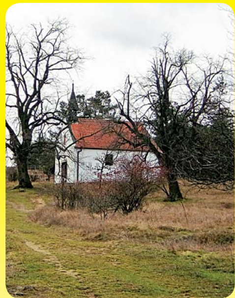
Kaple Panny Marie Bolestné

Půjdete-li jen malý kousek dál po červené značce, přijdete na Havranické vřesoviště, kde je i kaple Panny Marie Bolestné, jež byla postavena v roce 1680 po morové epidemii.