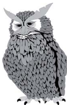
Srdečně zvou myslivci

MYSLIVECKÉ SDRUŽENÍ "VÝROVKA o.s. STŘELICE pořádá v sobotu 11. ledna 2014 v sálech sokolovny ve Střelcích TRADIČNÍ