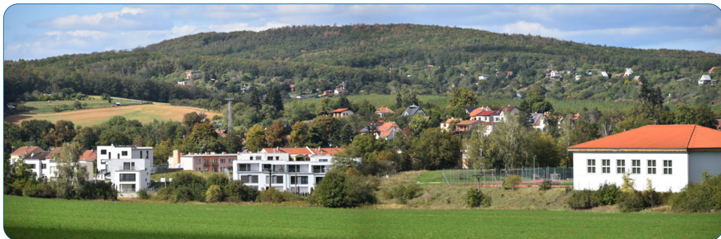
Pohled k chatovým oblastem Haneky, Mastná hora