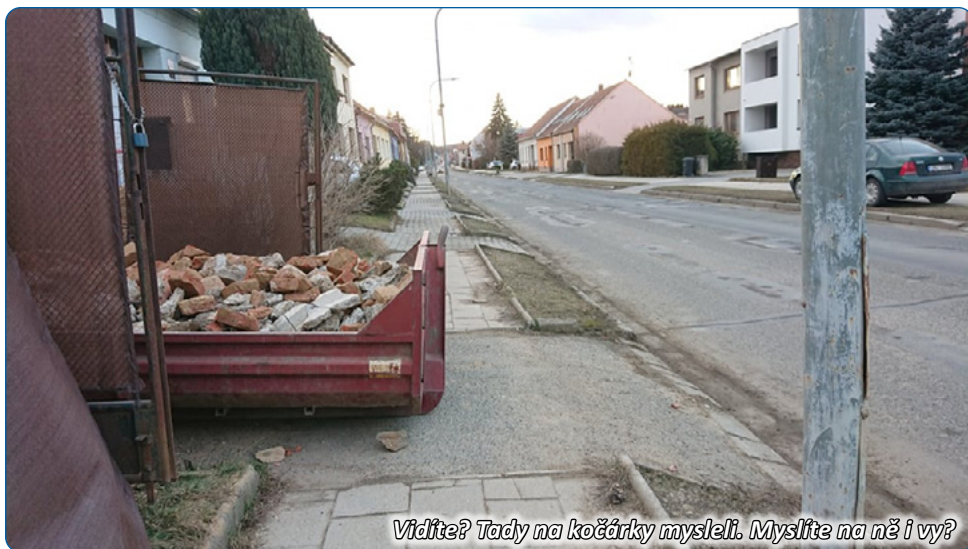
Vidíte? Tady na kočárky mysleli. Myslete na ně i vy?