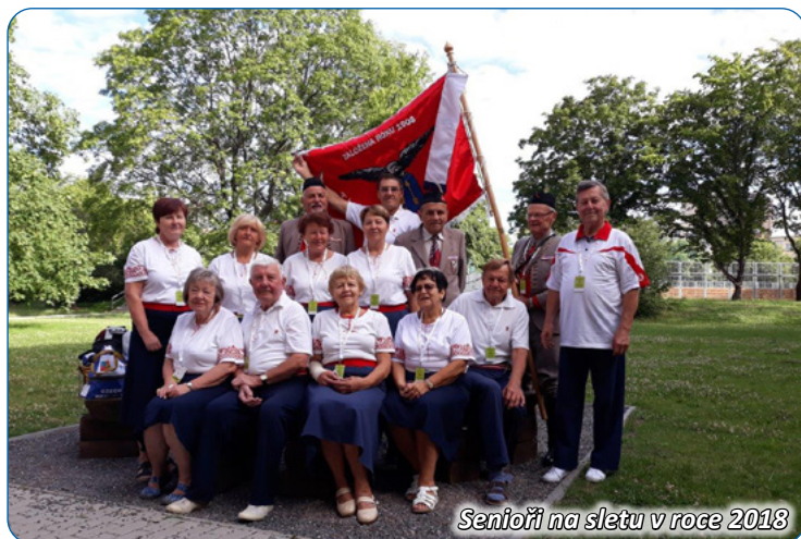
Senioři na sletu v roce 2018

Na Sokolských stránkách www.sokolstrelice.cz najdete cvičení pro všechny věkové kategorie.