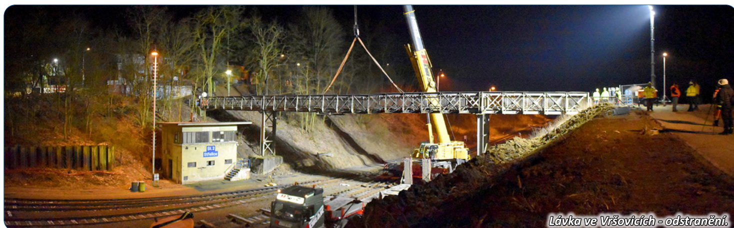
Lávka ve Vršovických - odstranění.