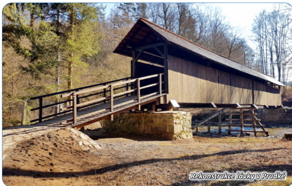
Rekonstrukce lávky v Prudké

Již jedenáctý ročník této soutěže vyhlásila Nadace dřevo pro život, která se snaží podporovat užívání dřeva jakožto obnovitelného zdroje pro stavbu. Projekt zaštil ministr zemědělství Miroslav Toman, Ministerstvo životního prostředí a Ministerstvo průmyslu a obchodu. Pokud tedy hledáte tip na nějaký výlet, zkuste se inspirovat na stránkách www.drevoprozivot.cz/drevena-stavba-roku . Na těchto stránkách si také můžete prohlédnout všechny soutěžní stavby.