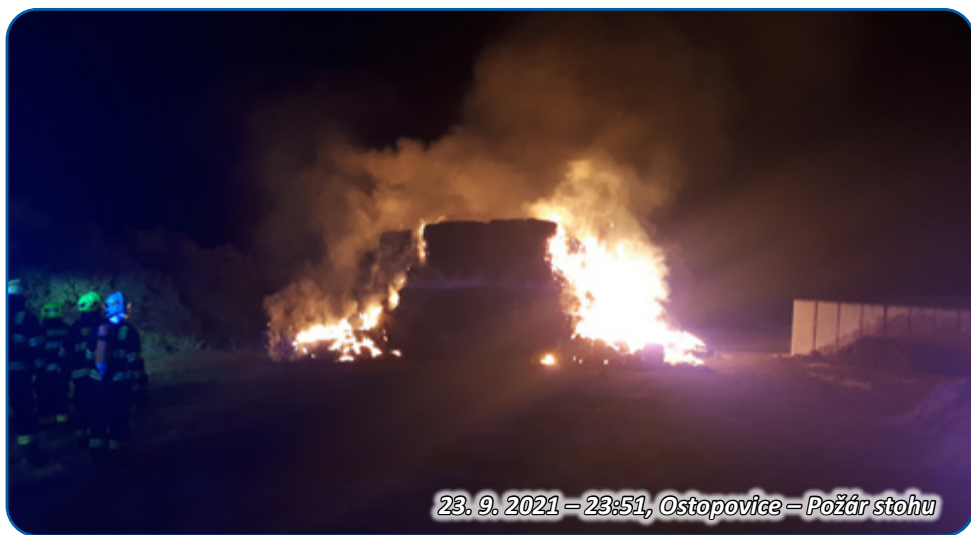
23. 9. 2021 – 23:51, Ostopovice – Požár stohu