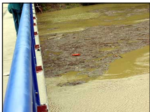
Obr. 2 - ADCP měření v profilu s naplaveninami - most přes vodní nádrž Vranov - mezi obcí Bitov a hradem Cornštejn