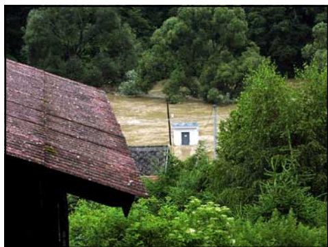
Obr. 1 - Podhradí nad Dyjí - zaplavená vodoměrná stanice