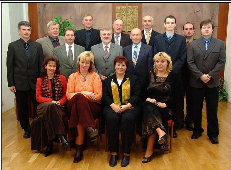
Zastupitelstvo obce

Mezi menší, ale velmi naléhavé akce patří opravy stávajících chodníků, které jsou někde ve zbudovaném stavu, dále bychom se měli pokusit najít místo pro a realizovat alespoň jedno dětské hřiště a dále veřejně přístupné sportoviště.