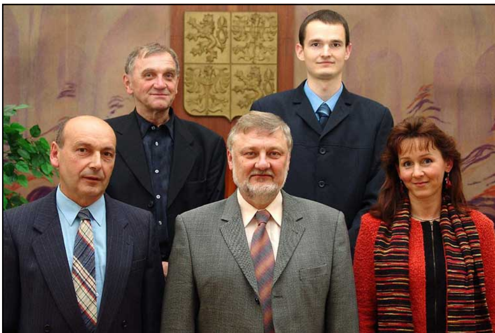
Rada Obce