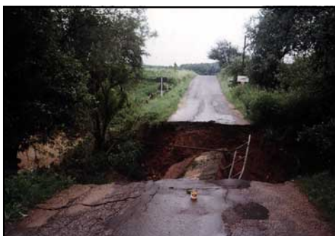
Obr. 3 - Škody po extrémních srážkách - most přes místní potok v Janově