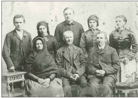
Jedna z nejstarších fotografií zachycující střelickou rodinu, kterou můžete na výstavě uvidět.

Na výstavě máte také prostor a čas si s ostatními účastníky popovídat a zavzpomínat na ty, kteří nám v naší obci připravili naši současnost.