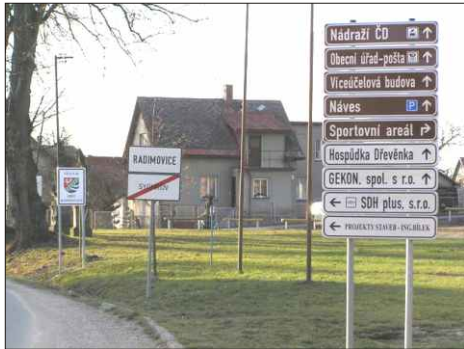
Foto: Podobný informační systém připravuje i obec Střelice