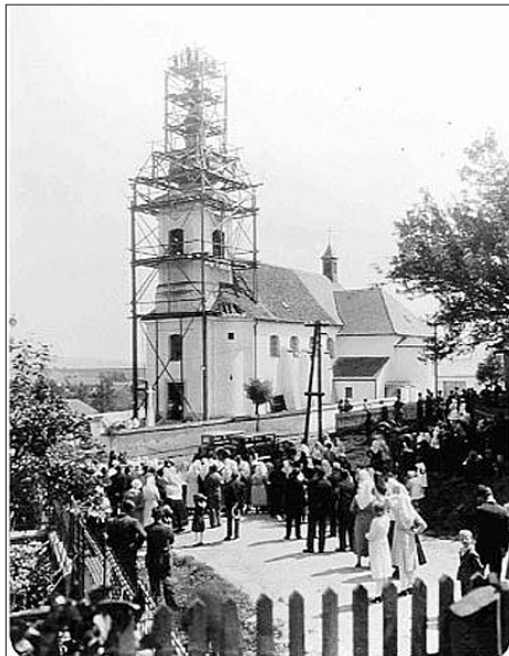
VKLÁDÁNÍ PAMÁTEČNÍCH LISTIN - DO BÁNĚ VĚŽE STŘELICKÉHO KOSTELA - FOTO. 1.7. 1934