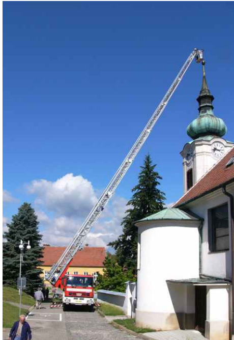
Pokus o opravu nahnutého kříže na střelickém kostele (článek uvnitř Střelického zpravodaje).