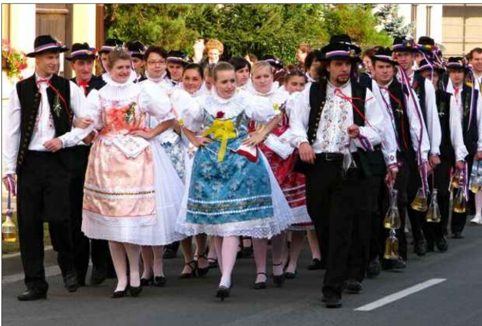
Ve dnech 18. – 19.10.2008 se konaly Staré hody, které pořádalo SDH Střelice a stárci. V sobotu 18. října ve 14:00 hodin proběhlo zvaní stárků. V neděli 19. října odpolední hodová veselice v sokolovně, kde k poslechu a tanci hrála dechová hudba Petrovanka.