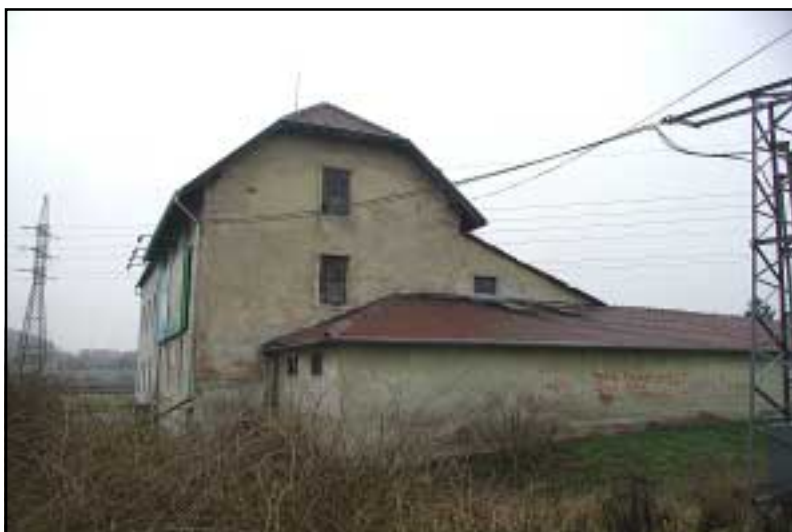
Ostopovský (Palánkův) mlýn s tubínou v Ostopovicích.