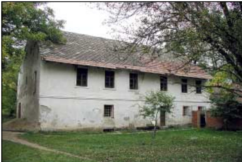
Podskalský mlýn s vodním kolem v Ostopovicích.

Na tomto místě jsme zveřejnili v minulém čísle zpravodaje povídání o ostopovském mlýnu. Dovolte nám, abychom vám na tom to místě představili oba mlýny na katastru obce Ostopovice, omluvili se za chybu v názvu a napravili ji. Děkujeme za pochopení.