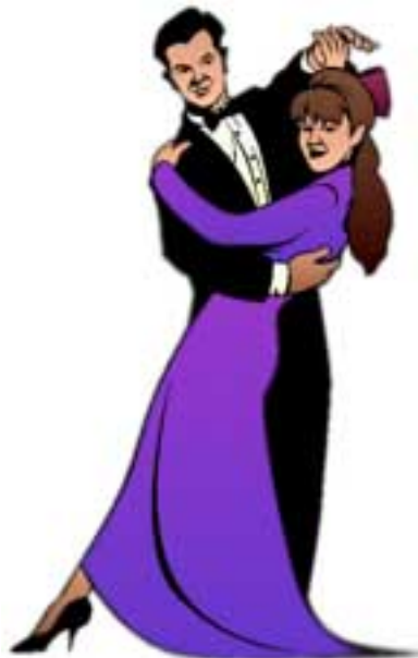
Plesová sezóna je v plném proudu

Ředitel Hasičského záchranného sboru okresu Brno-venkov se sídlem Brno, Solniční č. 4 oznamuje zánik této příspěvkové organizace. Současně oznamuje vznik nového právního subjektu - Hasičský záchranný sbor Brněnskému kraje se sídlem Brno Štefánikova 32 na základě zákona 238/2000 s účinností od 1.1.2001. Úkoly na úseku požární ochrany v okrese Brno-venkov bude zabezpečovat územní odbor HZS Brněnskému kraje se sídlem Moravské náměstí 6. Odbor prevence byl přestěhován na ulici Joštova, II. poschodí budovy OkU Brno-venkov.