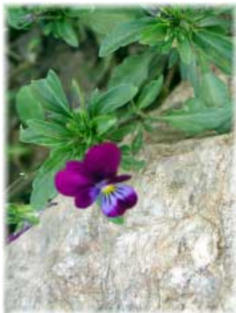
Jaro otevírá svou náruč.

Dne 12.2.2001 proběhlo výběrové řízení na nový nájemní vztah, do kterého se přihlásilo 5 účastníků. Po seznámení s nabídkami rozhodla RO vyřadit ze soutěže jednoho účastníka na základě nepředložení koncesní listiny. Dalším hodnocením byli vybráni vítěz a 1. náhradník výběrového řízení. Vzhledem k dohodě v současné smlouvě je však obec povinna dostát závazku vůči současnému nájemci a přednostně mu nabídnout nově koncipovaný smluvní vztah. Pokud tento nebude s návrhem smlouvy